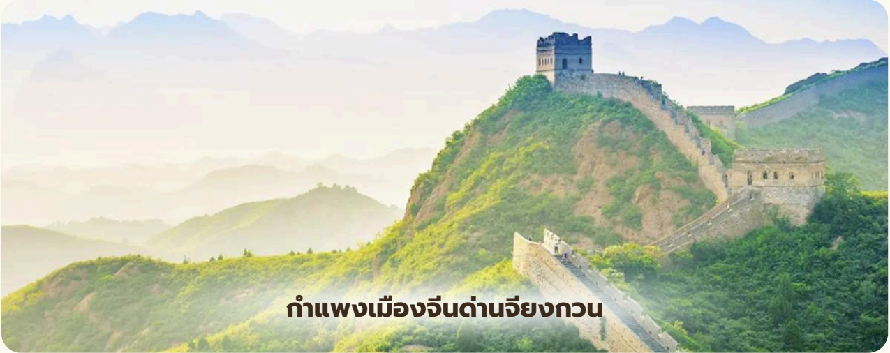
กำแพงเมืองจีนด่านเจียงกวน

กำแพงเมืองจีนด่านเจียงกวน - ผ่านชมสนามกีฬาฟาริงก - ถนนโบราณหนานโหลวกู่เซียง - ถนนคนเดินหวังฟูจิง