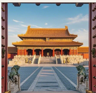
ชมพระราชวังต้องห้าม

จัตุรัสเทียนอันเหมิน • พระราชวังกู้กง • หอฟ้าเทียนถาน • ถนนโบราณเวียนเหมิน • พระราชวังฤดูร้อน • วัดลามะ • กำแพงเมืองจีนด่านฉีงกวน • ถนนโบราณหนานโหลวกู่เซียง