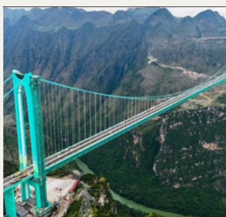
สะพานฮวาเจียง