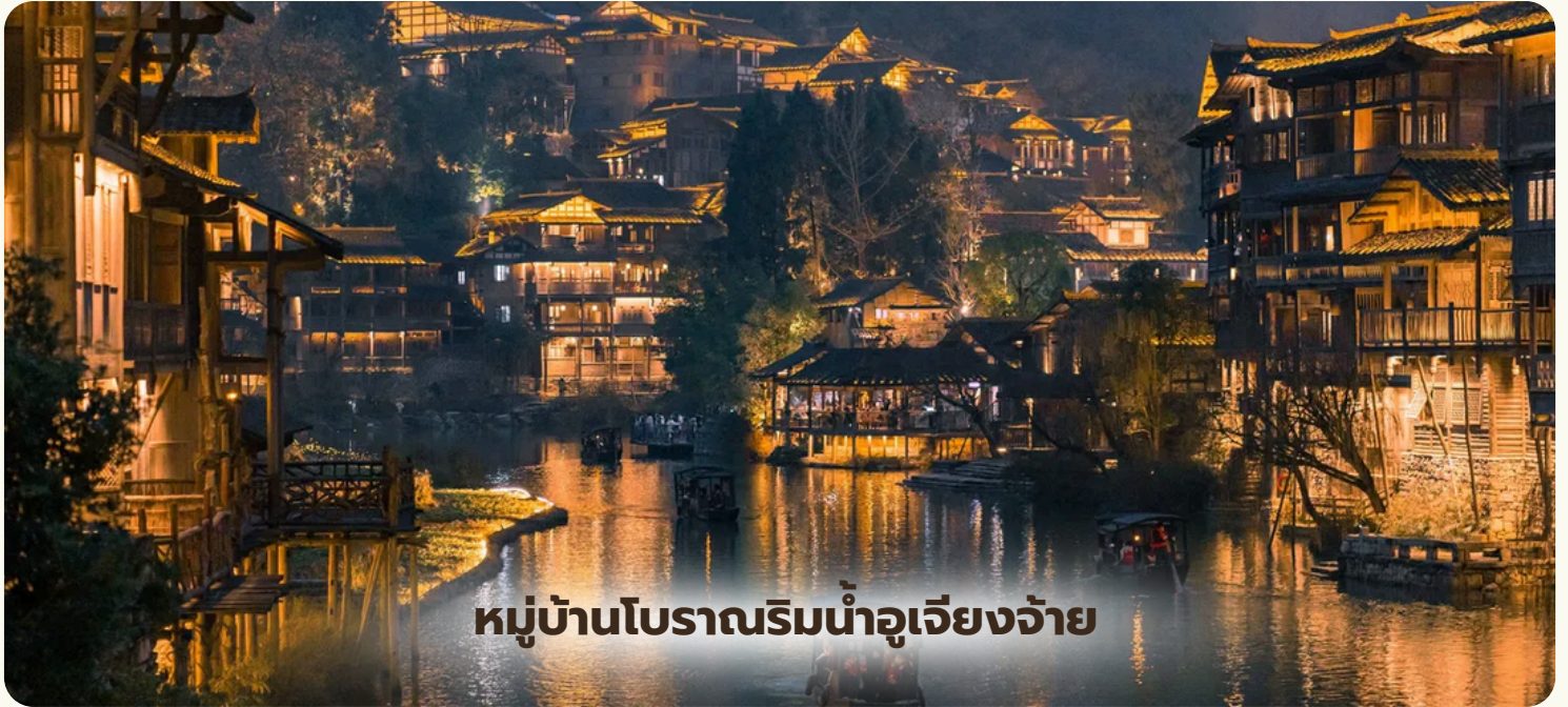
หมู่บ้านโบราณริมน้ำอูเจียงจ้าย

วัดขงจื้อ - เที่ยวชมหมู่บ้านโบราณริมน้ำอูเจียงจ้าย (รวมล่องเรือ)