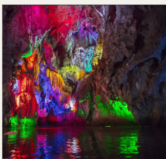
ล่องเรือถ้ำมังกร