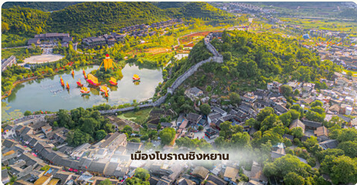
เมืองโบราณซิงหยาน

เมืองกุ้ยหยาง - เมืองโบราณซิงหยาน - ตลาดซิงหยุน